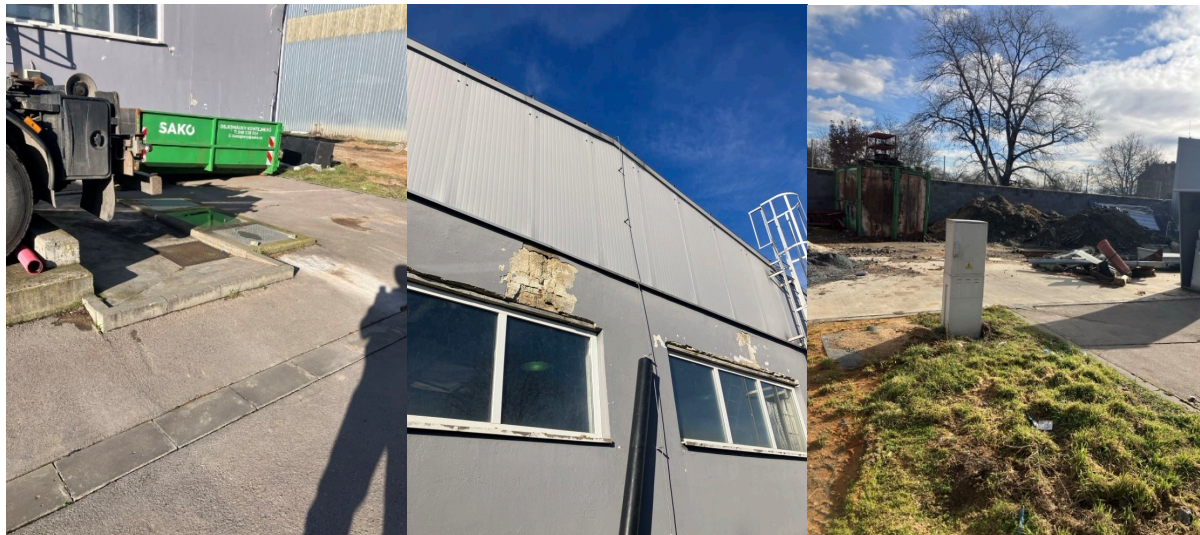
Obr. 1 ČOV – čištění popelnic

štítové stěně se nyní nacházejí okenní otvory, svod hromosvodu a ocelový žebřík s možným výletem na střechu, všechny tyto prvky budou demontovány a odstraněny, nebo přemístěny na jiné místo.