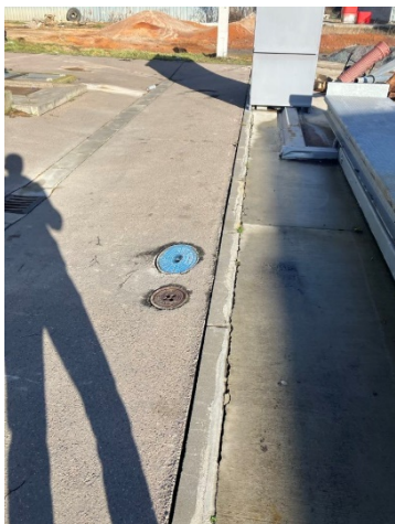
Obr. Stávající vodovod pod budoucím objektem

potrubí a propojení se stávajícím potrubím je 42,5 m. Potrubí je provedeno z PE100 SDR11 PN16, DN 110 mm. Poloměr oblouku ohybu bude stanoven na základě podkladů výrobce s ohledem na teplotě okolního vzduchu při realizaci. Potrubí pod budoucím objektem bude vedeno v nově zřízeném „energokanálu“. Napojení potrubí bude provedeno navrtávkou ve vedlejší místnosti skladu, poté povede potrubí v chrániče pod základovým prahem.